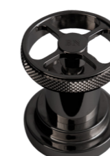
BN Nichel Nero Black Nickel

*Tutte le colorazioni RAL inclusi nero bianco e rosso saranno preventivate su richiesta.