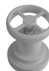
SPECIAL RAL Grigio Perla Perl Grey