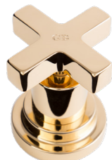
GB Gold Brass Gold Brass