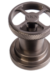
NKN Nichel Nero Spazzolato Brushed Black Nickel