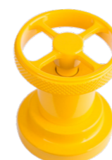
SPECIAL RAL Giallo Yellow