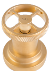
SG Oro Satinato Satin Gold