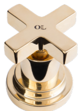
OL Ottone Lucido Shining Brass