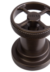
DBM Bronzo Scuro Opaco Dark Bronzed Matt