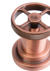
RA Rame Copper Plated