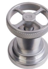
CB Cromo Spazzolato Brushed Chrome