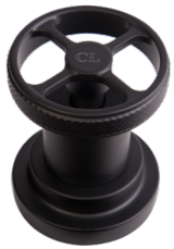
CL NEM Nero Opaco Matt Black