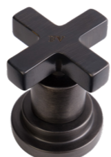
FV Ferro Vecchio Opaco Old Iron Matt