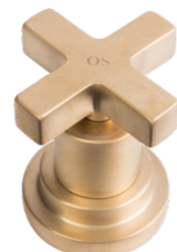
OS Ottone Spazzolato Brushed Brass