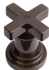
DB Bronzo Scuro Dark Bronze