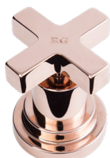
RG Oro Rosa Rose Gold