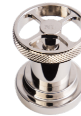
NL Nichel Lucido Polished Nickel