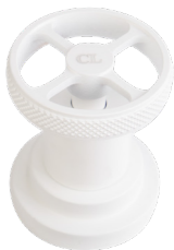
CL BIM Bianco Opaco Matt White