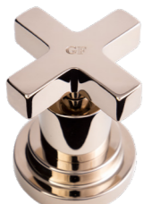
GF Oro Inglese English Gold