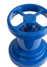
SPECIAL RAL Blu Blue