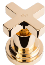
GO Oro Gold