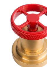
SPECIAL RAL + SG Rosso + Oro Satinato Red + Satin Gold