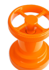
SPECIAL RAL Terra Di Fuoco Land Of Fire