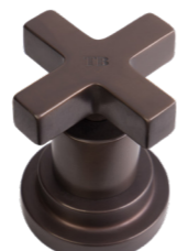
TB Tuscan Brass Tuscan Brass