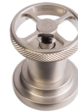
NS Nichel Satinato Satin Nickel

Attention to detail, love for classic lines but also creative research and improvement of the compositional lines. Customized design thought to create endless creative solutions. Faucets that define the space in which they are introduced, combining various possibilities between materials and colors. A huge range of possibilities capable to contribute to the definition of the living spaces.