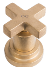
OG Ottone Grezzo Raw Brass