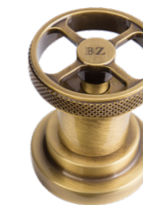
BZ Bronzato Bronzed Plated