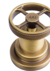
AG Antique Gold Opaco Antique Gold Matt