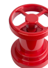
SPECIAL RAL Rosso Red